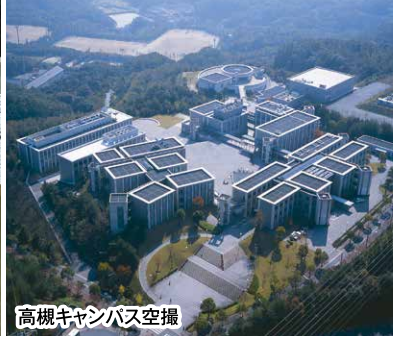
高槻キャンパス空撮