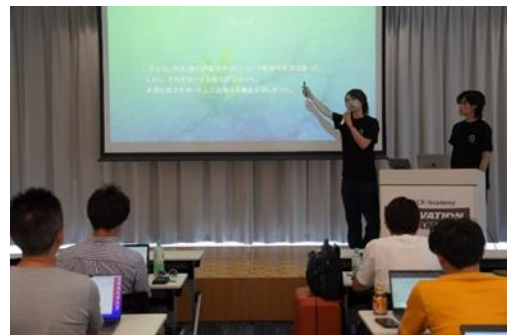
<イノベーションキャンプ2023の様子>